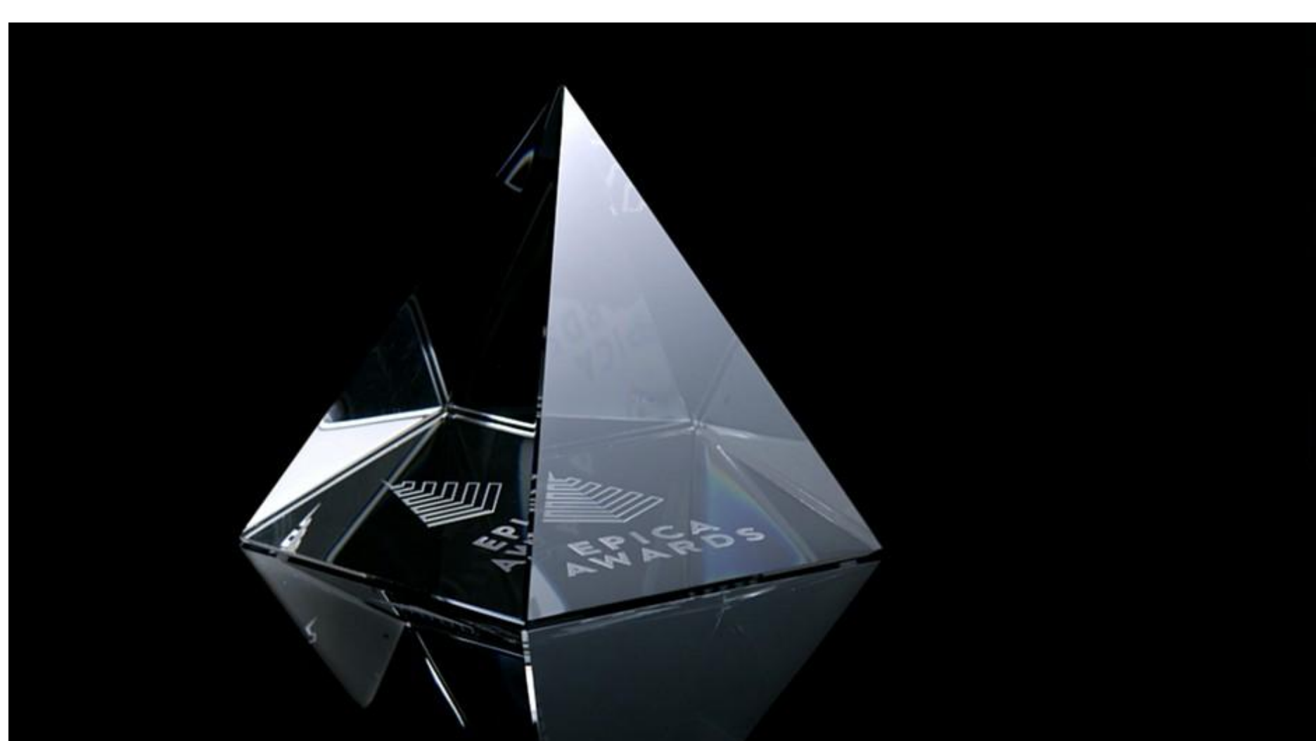
Bei den Epica Awards wurden auch Schweizer Arbeiten ausgezeichnet.

Ruf Lanz gewinnt am internationalen Kreativ-Award die meisten Auszeichnungen. Eine weitere geht an Wirz.