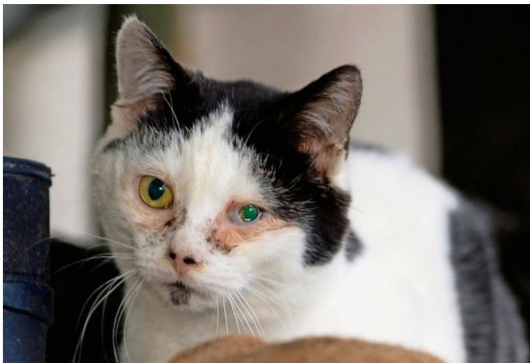
Die Bevölkerung ist stärker auf Tierquälerei sensibilisiert: Vernachlässigte Katze aus dem Emmental.

Die Zahl der Verfahren wegen Tierschutzdelikten hat sich in den letzten zehn Jahren verdreifacht. Opfer sind meist Haustiere.